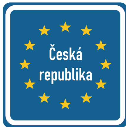
IP 30 Státní hranice

„kk) „Státní hranice“ (č. IP 30), která označuje státní hranici při vstupu do České republiky. Při výstupu z České republiky se uvede značka upozorňující na vstup do dalšího členského státu Evropské unie s názvem tohoto státu („Bundesrepublik Deutschland“, „Polska“, „Republik Österreich“ nebo „Slovenská republika“). Pod značkou může být umístěna dodatková tabulka č. E3a s údajem o vzdálenosti státní hranice státu uvedeného na značce.“.