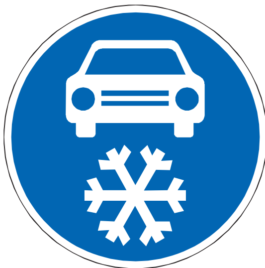
C 15a Zimní výbava