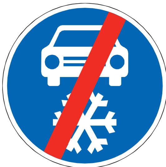
C 15b Zimní výbava – konec