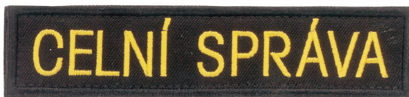
Žlutý nápis „CELNÍ SPRÁVA“ Obr. 4