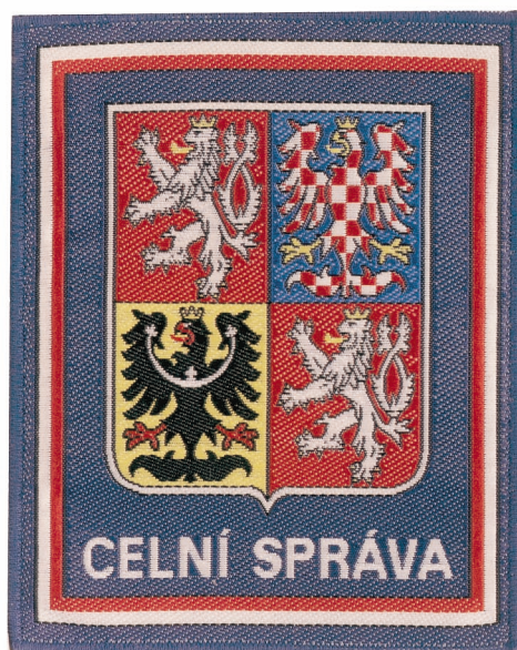
Rukávový znak Obr. 3