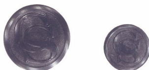
Stejnokrojové knoflíky Obr. 6