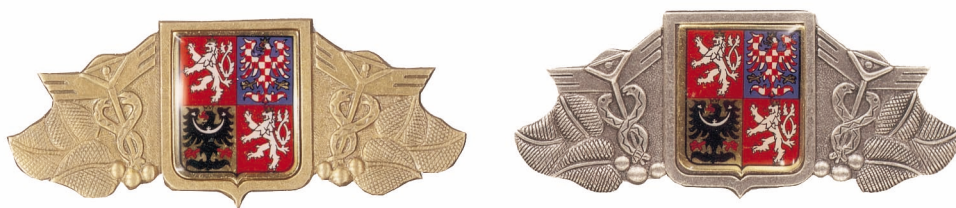
Odznaky na čepici – zlatý a stříbrný Obr. 5