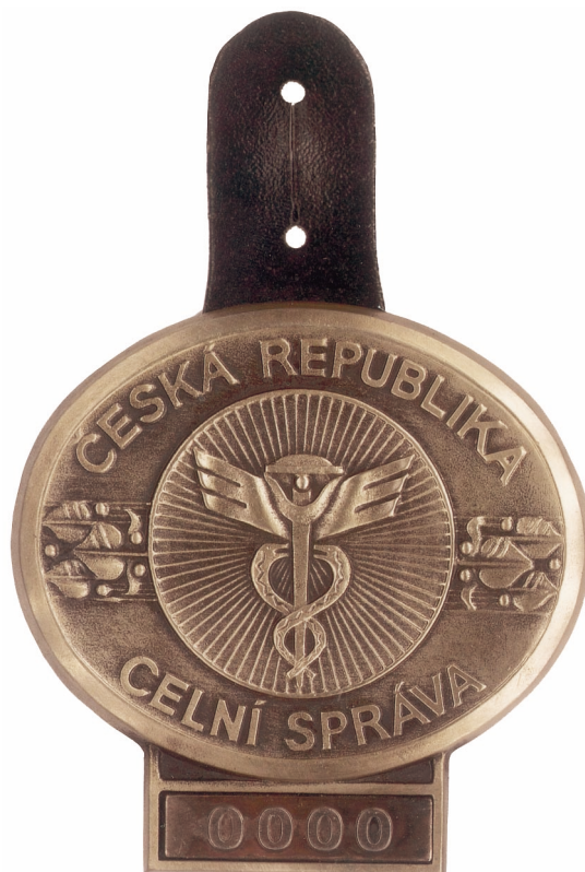
Identifikační znak celní správy Obr. 1

Vyobrazení identifikačního znaku celní správy, symbolu celní správy, rukávového znaku, nápisu „CELNÍ SPRÁVA“, odznaků na čepici a stejnokrojových knoflíků