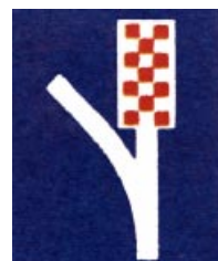
D 51 Únikový pruh

Díl I. oddíl I. Svislé dopravní značky bod 4. INFORMATIVNÍ ZNAČKY se doplňuje o vyobrazení dopravní značky