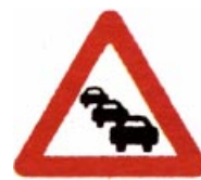
A 28 Kolona

Díl I. oddíl I. Svislé dopravní značky bod 1. VÝSTRAŽNÉ ZNAČKY se doplňuje o vyobrazení dopravní značky