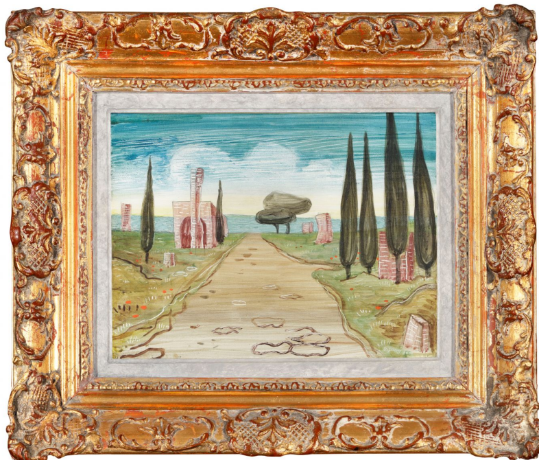
Jan Zrzavý, Via Appia, 1936, olejová tempera na dřevěném panelu

Obraz Maurice Vlamincka , La Maison Grise , z roku 1914 dosáhl na vysokou částku 6.530.000 Kč.