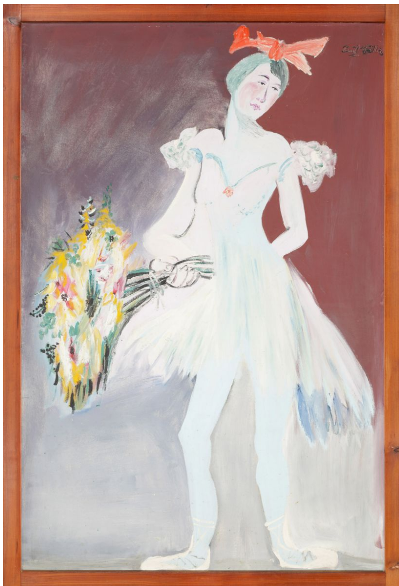
Emil Filla, Baletka s květinami, 1947-1948, olej na plátně

Obraz Jana Zrzavého , Via Appia , z roku 1936 se prodal za 4.000.000 Kč.