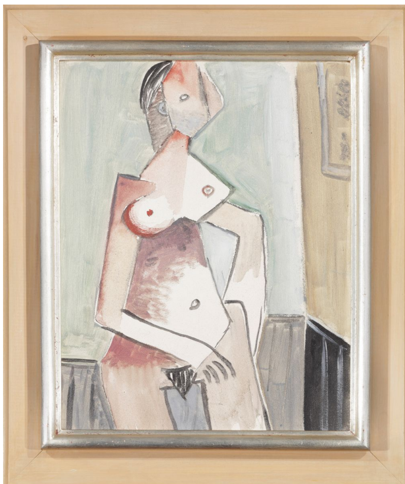
Alois Wachsman, Figura (Stojící nahá žena), 1930, olej na lepence

Netradiční položku aukce představoval obraz Václava Havla. Bílý kůň ve vesmíru . Tato memorabilia se prodala za neuvěřitelných 3.025.000 Kč.