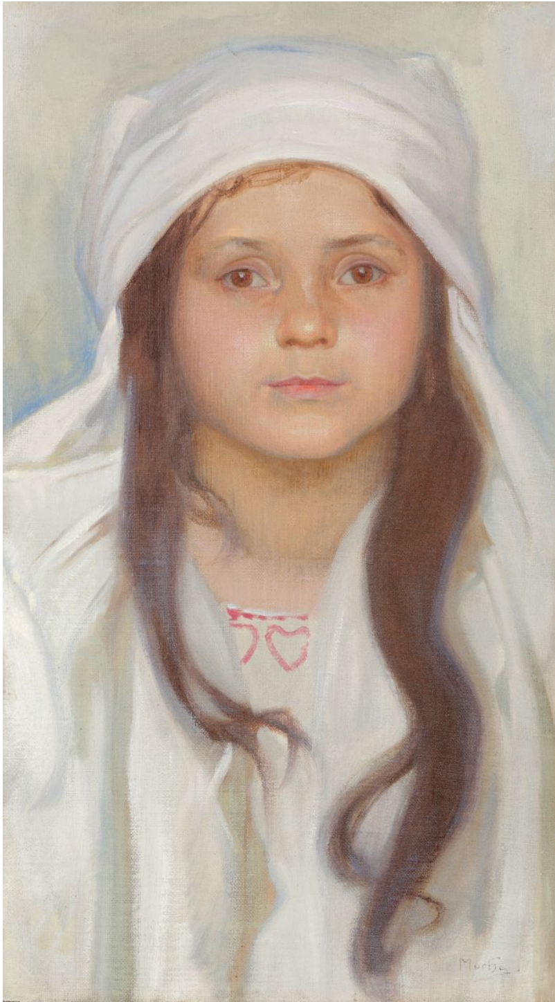
Alfons Mucha, Sváteční portrét, olej na plátně podložený kartonem

Obraz Emila Filly , Baletka s květinami , z roku 1947-1948 dosáhl na 8.700.000 Kč.