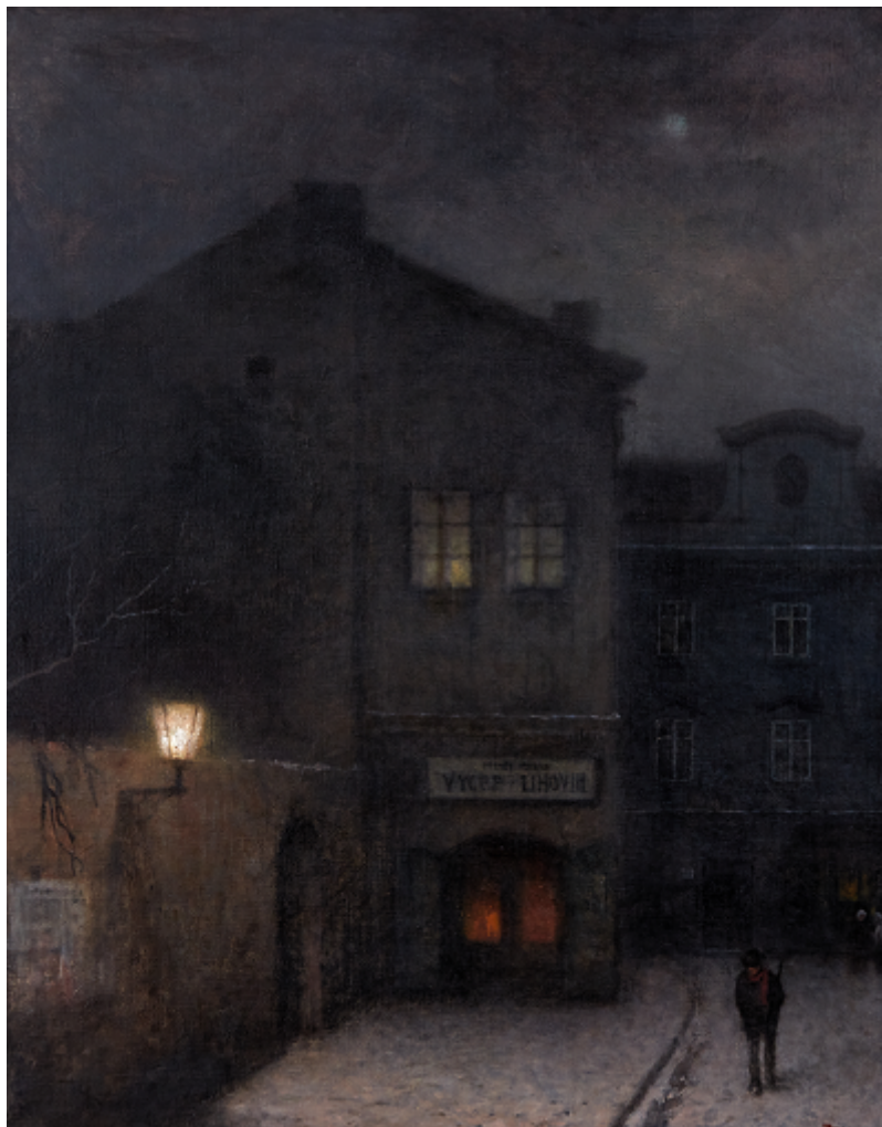
Jakub Schikaneder, Staropražské nokturno, 1900–1910, olej na plátně, 116,5 x 92 cm

Dne 28. listopadu zahájíme v malé galerii Adolf Loos Apartment and Gallery v Mánesu výstavu s názvem „Jakub Schikaneder: mistr nálad a melancholické poezie“. Tato částečně prodejní výstava představí jednoho z nejvýznamnějších českých malířů 19. století a jeho unikátní oleje ze soukromých sbírek.