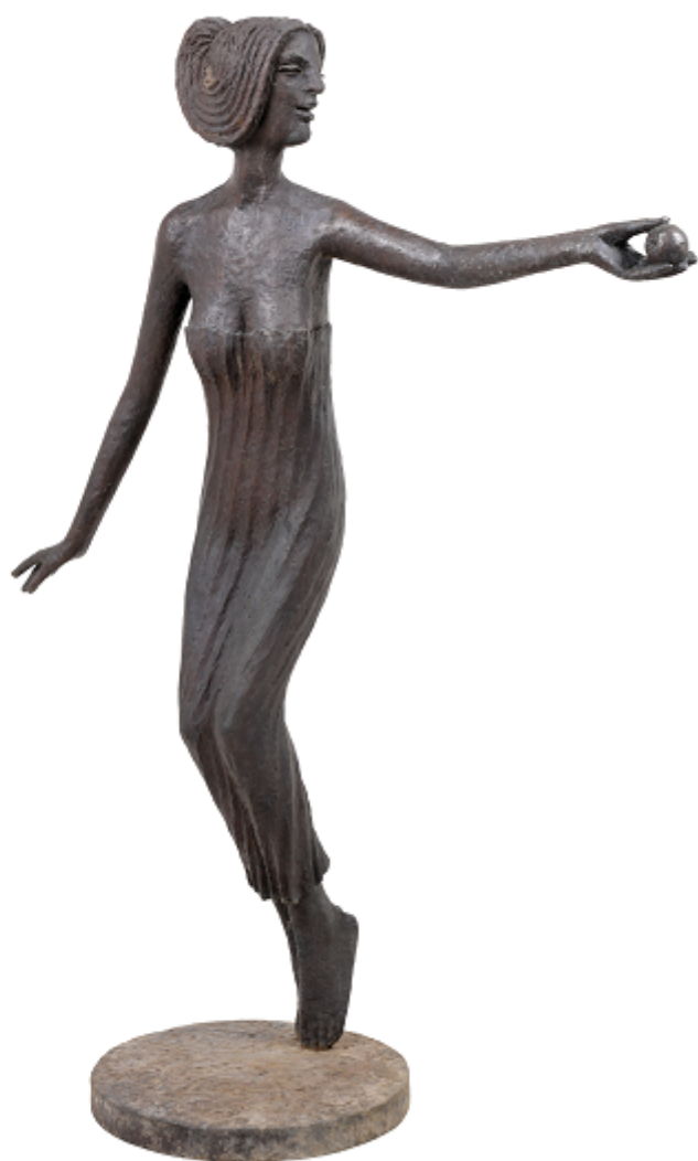
Olbram Zoubek, Afrodité s jablkem , 1996, bronz, výška 212 cm, vydraženo: 1.452.000 Kč