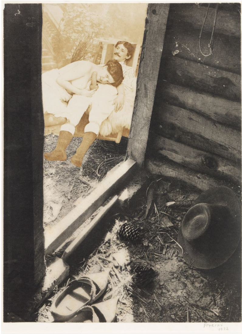
Jindřich Štyrský, Neděle na předměstí, 1932, koláž na papíře