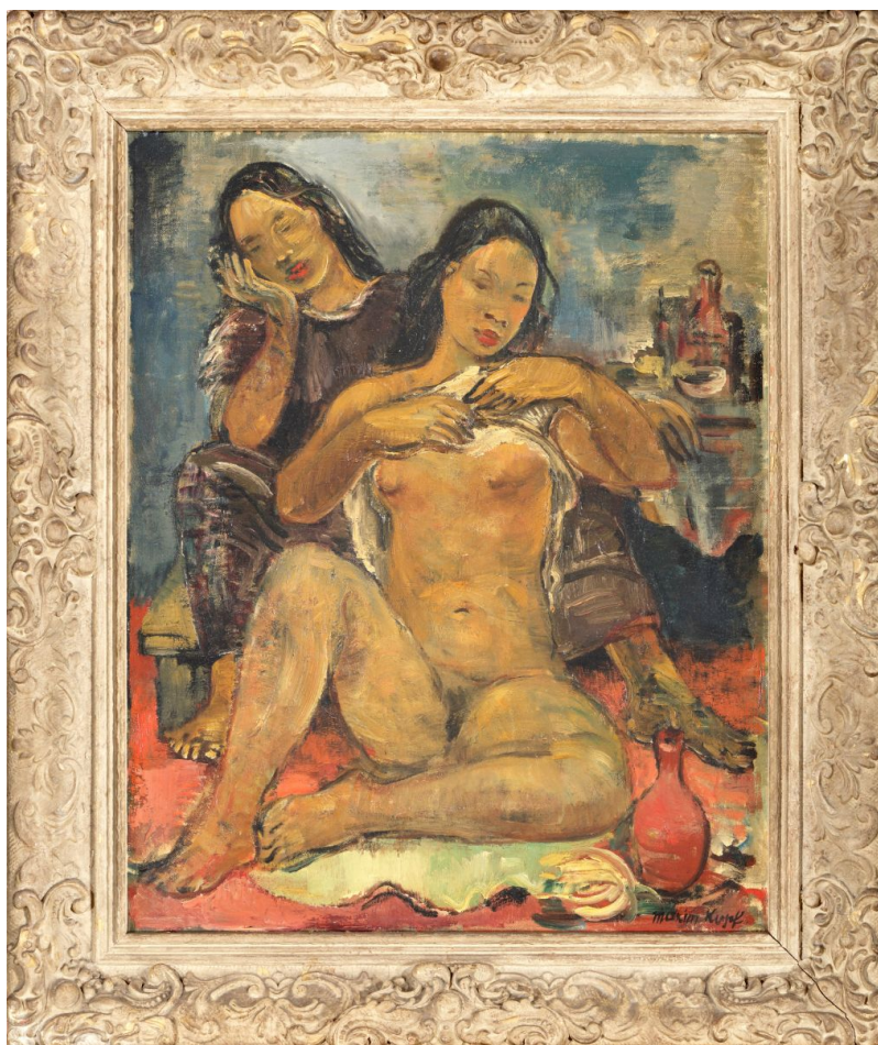
Max (Maxim) Kopf, Tahitanky, olej na plátně

Skvostné dílo Tahitanky od Maxima Kopfa , které vytvořil při svém pobytu na Tahiti, Markézách a Martiniku mají v jeho tvorbě přirozenou exotickou atmosféru. Tato vzácná plátna dosahují oslnivých kvalit. I zde je stanovena vyvolávací cena na 1.900.000 Kč.