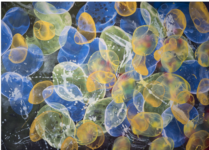
Jiří Georg Dokoupil, Bez názvu, 2017, akryl, pigment a mýdlové bubliny na plátně

Pozornost sběratelů a investorů nepochybně přitáhnou i další exkluzivní díla například Františka Kupky, Zdeňka Sýkory, Františka Drtikola, Jiřího Koláře, Václava Špály, Jana Saudka, Milana Paštéky, Františka Viznera, Oty Janečka, Jiřího Trnky, Josefa Čapka, Františka Tichého, Kamila Lhotáka, Bohumíra Matala, Václava Boštíka, Josefa Jíry, Julia Mařáka, Adolfa Borna, Adrieny Šimotové, Joana Miró a dalších.