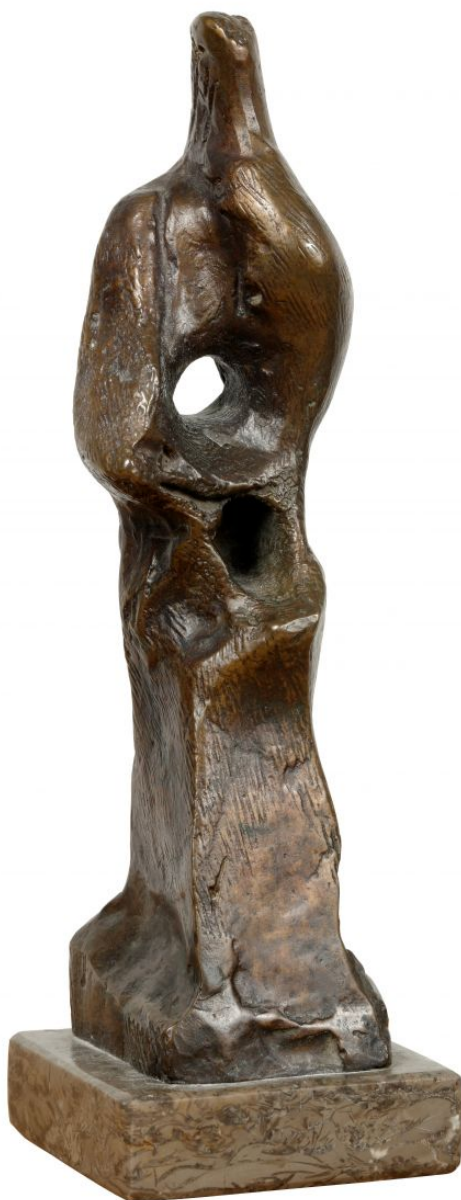
Henry Moore, Stojící muž, 1981, bronz