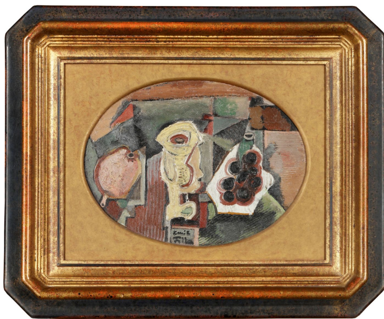
Emil Filla, Jablko, pohár a hrozen vína, 1923, olej na plátně