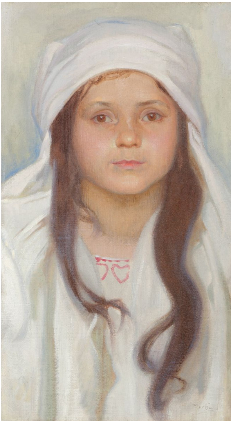
Alfons Mucha, Sváteční portrét, olej na plátně podložený kartonem