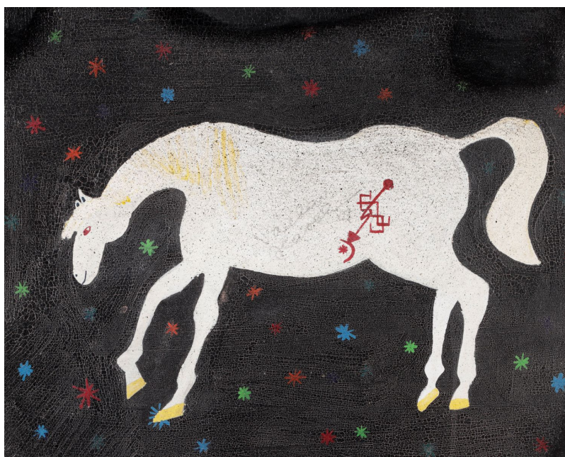
Václav Havel, Bílý kůň ve vesmíru , 1982, akryl na desce

Netradiční položku aukce představuje dílo Václava Havla . Jedná se o jedinou malbu, kterou vytvořil za svého života československý a následně první český prezident Václav Havel. Akryl na desce, z roku 1982, nese název Bílý kůň ve vesmíru . Jedná se o neopakovatelnou příležitost (nejen investiční) získat do sbírky dílo Václava Havla. Vyvolávací cena díla je 2.500.000 Kč.