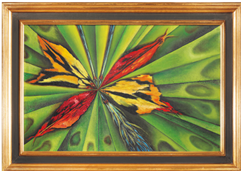
Toyen, Vidím, že má bílá stránka zezelenala, 1951, olej na plátně

Sběratelsky ceněný olej Vidím, že má bílá stránka zezelenala , z pařížského období Toyen zůstal dlouho v soukromé sbírce a dosud unikal větší pozornosti veřejnosti. Raritní obraz pochází z roku 1951, z období, kdy se malířka zabývala pod vlivem Bretona hermetismem a odkazy na alchymii. Obraz byl původně součástí sbírky malířky Toyen. Jedná se o první aukční prodej tohoto díla a jeho význam dokládá i fakt, že název obrazu byl použit na parte této významné surrealistické malířky. Vyvolávací cena obrazu je stanovena na motivačních 6.000.000 Kč.