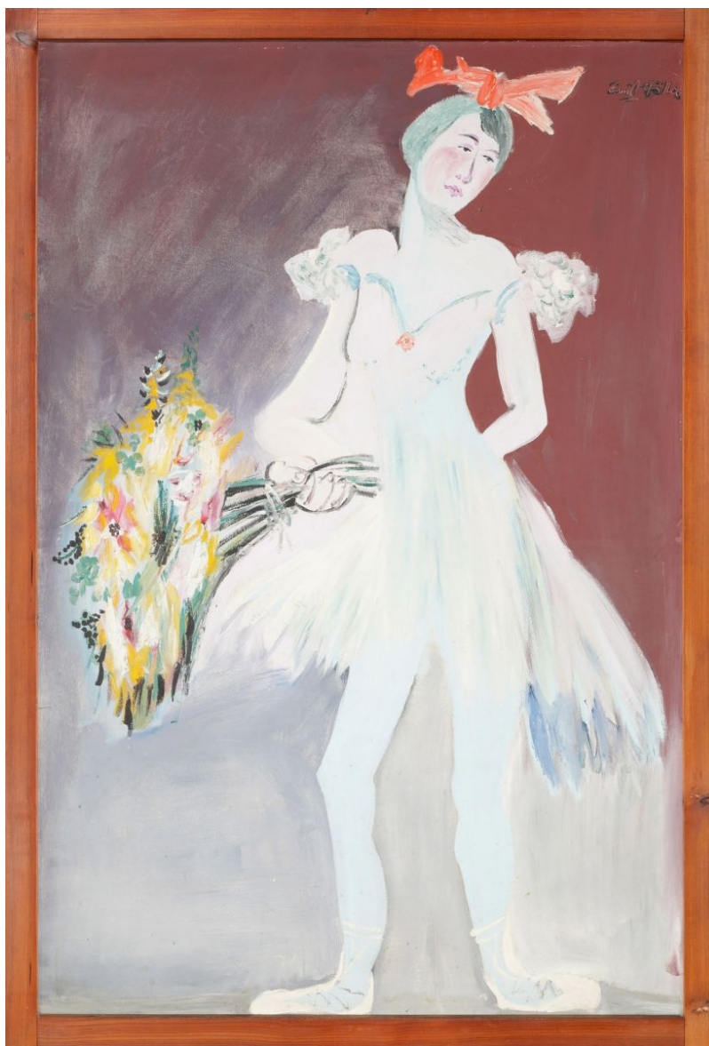
Emil Filla, Baletka s květinami, 1947-1948, olej na plátně

let 1947-1948. Dle rodinných informací šlo o portrét Fillovy přítelkyně - baletky, sólistky Národního divadla. Obraz měl být holdem jí, jejímu umění i kráse. Toto vysoce lyrické dílo, které do nedávna viselo v malířově obývacím pokoji, jde do aukce s vyvolávací cenou 5.000.000 Kč.