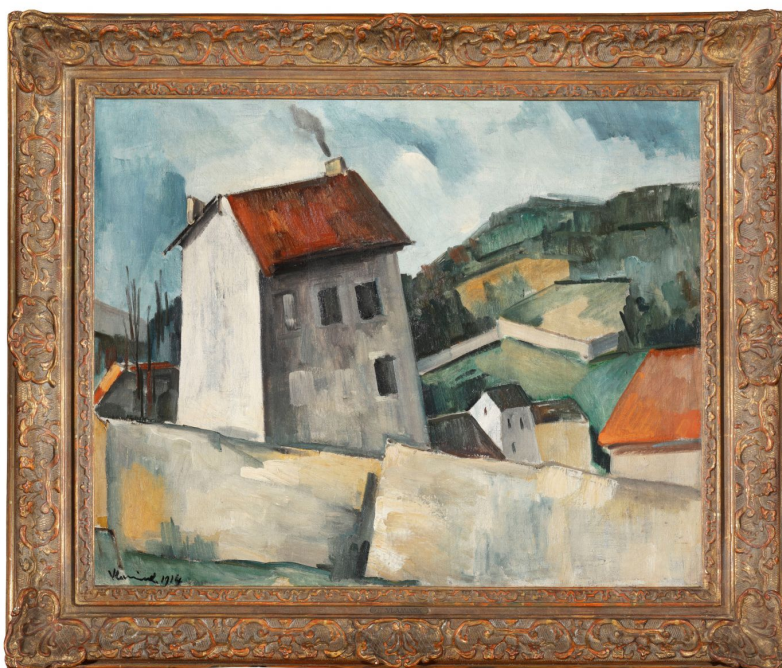
Maurice de Vlaminck, La Maison Grise , 1914, olej na plátně

Netradiční položku aukce představuje dílo Václava Havla . Jedná se o jedinou malbu, kterou vytvořil za svého života československý a následně první český prezident Václav Havel. Akryl na desce, z roku 1982, nese název Bílý kůň ve vesmíru . Jedná se o neopakovatelnou příležitost (nejen investiční) získat do sbírky dílo Václava Havla. Vyvolávací cena díla je 2.500.000 Kč.