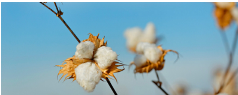
[surová bavlna Supima]

zde méně než 1 % bavlny pěstované na světě. Na rozdíl od obyčejné bavlny má Supima jedinečné vlastnosti: pevnost, měkkost a retenci barev. Vyniká také svou lehkostí – pouhých 100 g/m 2 , takže je mnohem měkčí a lehčí než ostatní saténové povlečení.