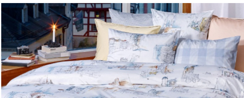
[povlečení Christian Fischbacher Weltenbrummler]

Pro Christian Fischbacher je typické, že veškeré vzory vznikají nejdříve ruční malbou a výběrem těch správných barev. Například povlečení s názvem Weltenbrummler vznikalo přímo v městečku St. Gallen a lze na něm spatřit panorama tradiční architektury s podkladem vodových barev.