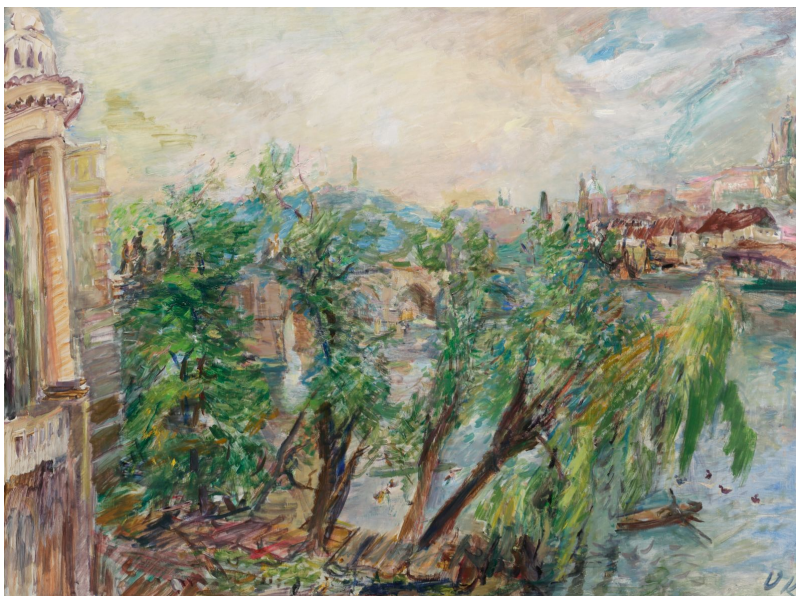
Oskar Kokoschka, Praha - Pohled z křížovnického kláštera , 1934, olej na plátně, 85 x 115 cm, vyvolávací cena: 68.000.000 Kč

Olej Praha - Pohled z křížovnického kláštera byl mnohokrát publikován a vystavován. Kokoschkovy obrazy malované z různých míst v Praze, např. ze Strahovského kláštera, ze zahrady Kramářovy vily, z obou břehů Vltavy a dalších míst jsou dnes součástí významných sbírek v Čechách i v zahraničí. Kokoschkův olej patří spolu s obrazy Praha - Karlův most (1934, sbírka Národní galerie v Praze) a Praha - Hradčany a Petřín (1936, sbírka The Phillips Collection, Washington D. C.) k jeho třem nejdůležitějším pražským vedutám . Kokoschka si pro práci na tomto obraze vybral malý balkon v křížovnickém konventu na Starém městě a odtud pak svými očima maloval Prahu téměř celé tři týdny. Díla jednoho z nejvýznamnějších malířů 20. století se na aukcích objevují jen vzácně, jedná se tak o jedinečnou a neopakovatelnou aukční příležitost. Obraz tohoto významu se na českém aukčním trhu nikdy v minulosti nedražil.