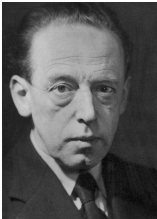
JUDr. Kamill Ressler advokát, obhájce K. H. Franka