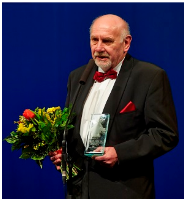
JUDr. Pavel Rychetský, předseda Ústavního soudu ČR